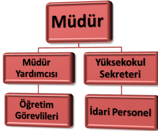
Şekil .1 Birim Hiyerarşik Yönetim Şeması